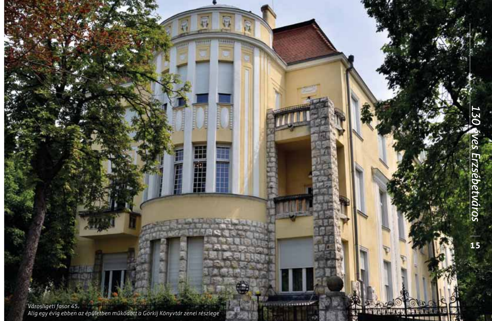
Városligeti fasor 45. Alig egy évig ebben az épületben működött a Gorkij Könyvtár zenei részlege

kik költöznek majd oda. A házakat méretes rácsokkal zárták el az akkoriban Gorkij névre hallgató, ma Városligeti fasor kíváncsiskodói elől. A környék jobb villáiban egészen az ötvenes évekig szovjet tanácsadók laktak. A fasor 1921-ben vette fel Vilma királynő (1880–1948) nevét, így köszönte meg a főváros Hollandia akkori királynőjének, hogy az I. világháború után éhező magyar gyerekek ezreit fogadták be holland családok. A Vilma királynő utat 1950-ben Gorkij (1868–1936) orosz-szovjet író, drámaíró után Gorkij fasorra változtatták.