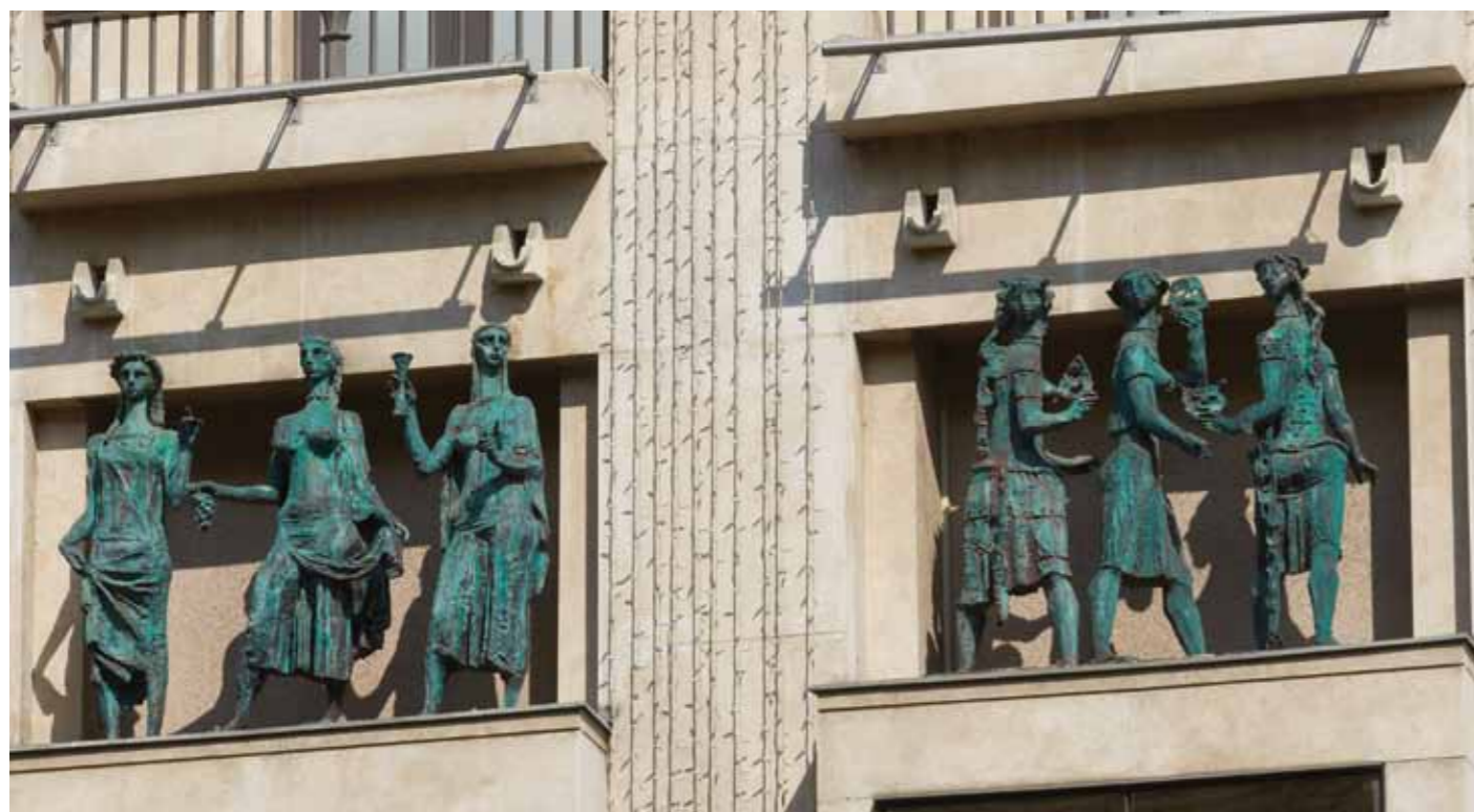
A Madách Színház homlokzatán álló öt darab hárommalakos, bronzból készült, allegorikus szoborcsoport egy részlete