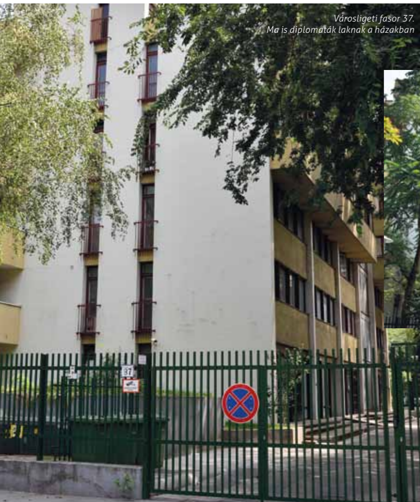
Városligeti fasor 37. Ma is diplomaták laknak a házakban

kik költöznek majd oda. A házakat méretes rácsokkal zárták el az akkoriban Gorkij névre hallgató, ma Városligeti fasor kíváncsiskodói elől. A környék jobb villáiban egészen az ötvenes évekig szovjet tanácsadók laktak. A fasor 1921-ben vette fel Vilma királynő (1880–1948) nevét, így köszönte meg a főváros Hollandia akkori királynőjének, hogy az I. világháború után éhező magyar gyerekek ezreit fogadták be holland családok. A Vilma királynő utat 1950-ben Gorkij (1868–1936) orosz-szovjet író, drámaíró után Gorkij fasorra változtatták.