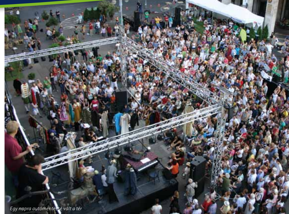
Egy napra autómentesé vált a tér