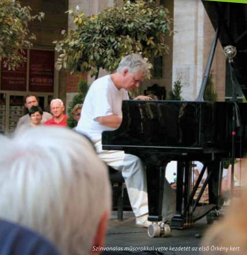
Színvonalas műsorokkal vette kezdetét az első Örkeny kert