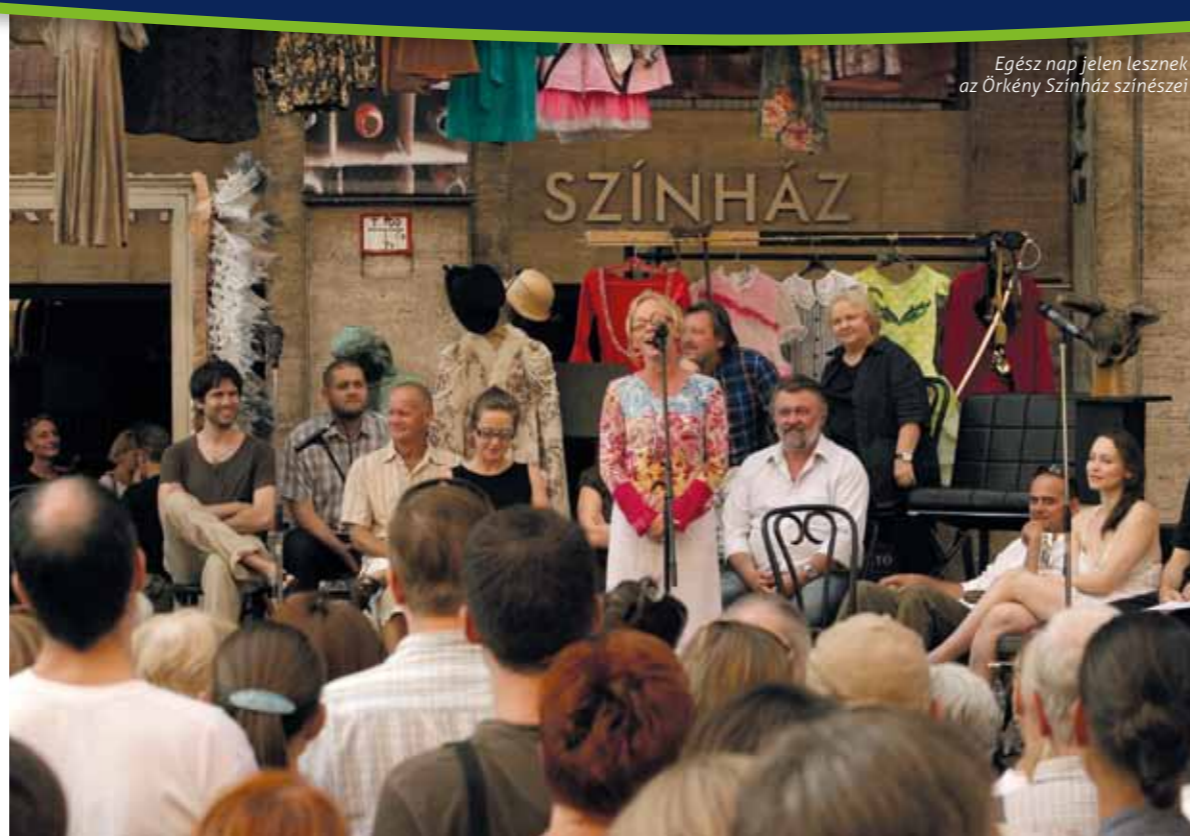
Egész nap jelen lesznek az Örkeny Színház színészei