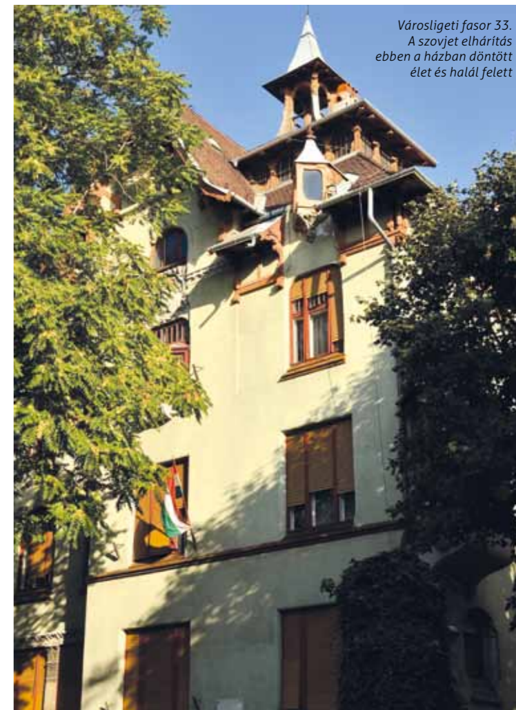
Városligeti fasor 33. A szovjet elhárítás ebben a házban döntött élet és halál felett

Mindazoknak ajánljuk figyelmébe a Budapest a diktatúrák árnyékában című könyvet, akiket érdekel a közelmúlt, városunk, Budapest és kerületünk, Erzsébetváros kevésbé ismert történelme, mert a kötetben lévő térképek segítségével múltidéző túra tehető a városban.