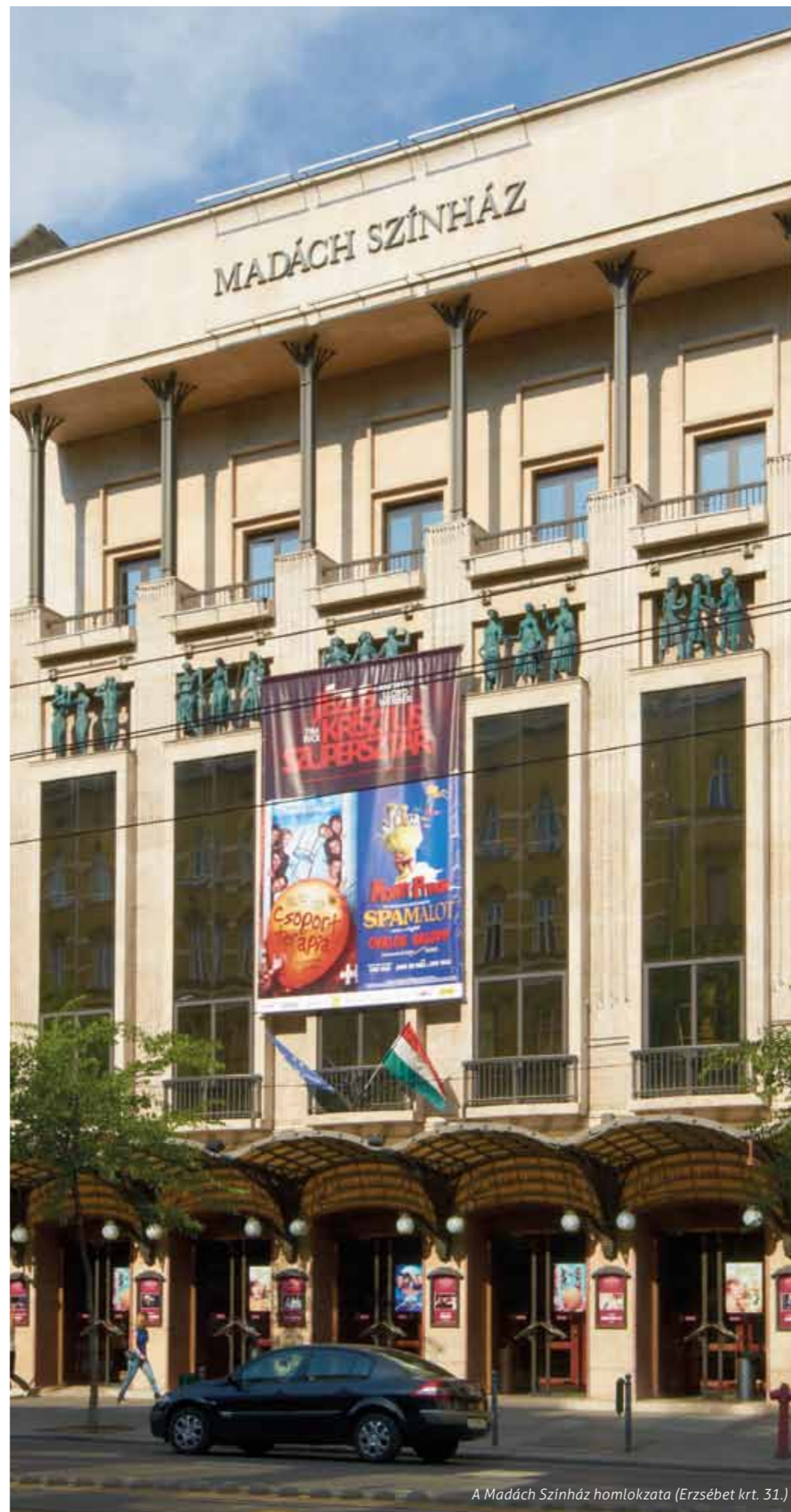
A Madách Színház homlokzata (Erzsébet krt. 31.)

kulturális intézmények” – mondta az igazgató.